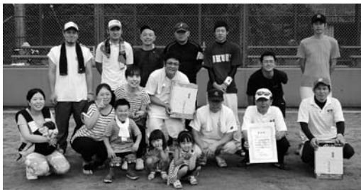
優勝 金剛峯寺カリバーズ