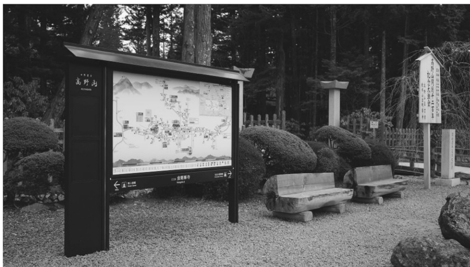
本山前の案内マップ板

マップのデザインは「内八葉外八葉」の蓮花にたとえられる高野山の峰々をバックに東の奥之院から西の大門の間に広がる壇上伽藍や総本山金剛峯寺をはじめ、宿坊52か寺、さらにバス停や学校、銀行、土産物店、コンビニ、トイレなどが英語表記も合わせて明示されています。主要建造物はその外観をイメージしたイラスト付きです。さらに壇上伽藍などの世界文化遺産に登録されている地域にはユネスコの世界遺産シンボルマークも表示されています。全体に従来の案内板に比べるとすっきりしたデザインに、えんじ色などの落ち着いた色調が映え、参詣者の現在地や目的地などがひと目でわかるように工夫されています。