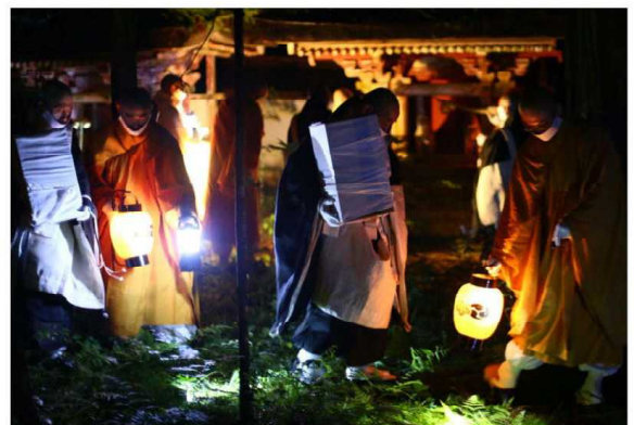
▼社殿より遷される御神体

【問い合わせ】 高野山真言宗総本山金剛峯寺開創法会事務局 TEL 56-1200