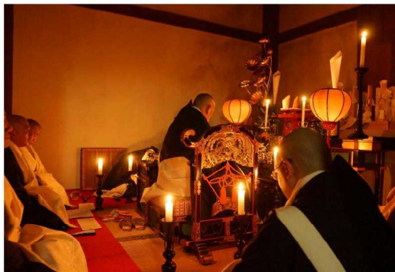
▼仮殿(参籠部屋)での御法楽

千二百年経った今でも、お稲荷さまとお大師さまとの約束は変わることなく続いています。