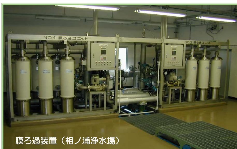
膜ろ過装置（相ノ浦浄水場）