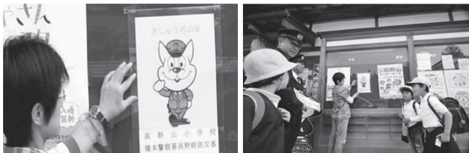
【問い合わせ】青少年センター ☎56-3050

子どもを犯罪や事故から守り保護するという主旨に賛同いただいた一般家庭や事務所を「きしゅう君の家」として防犯ポスター等を貼るなどして安全確保のために協力をお願いします。