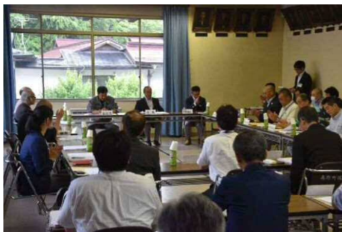
第 1 回高野町歴史まちづくり協議会の様子