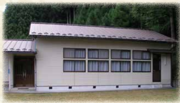
▲ 龍福寺跡の大滝集会所