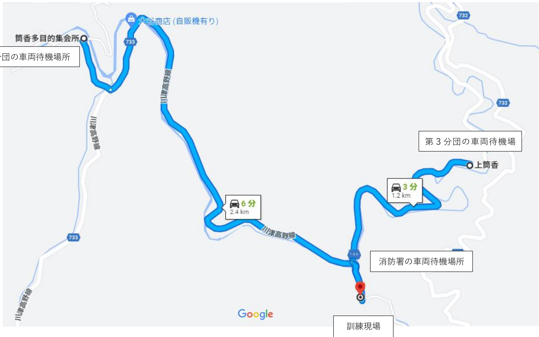
◇各隊の待機場所と出動経路図