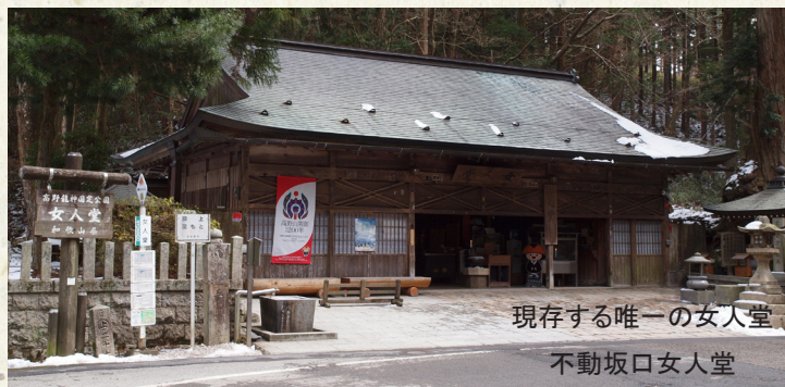
現存する唯一の女人堂