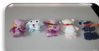
制作 ハンカチを使った 玩具作り