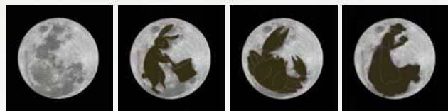
餅つきをするうさぎ