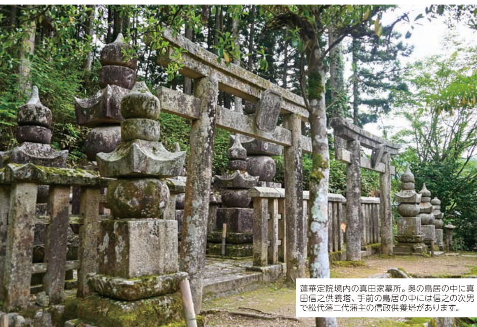
蓮華定院境内の真田家墓所。奥の鳥居の中に真田信之供養塔、手前の鳥居の中には信之の次男で松代藩二代藩主の信政供養塔があります。