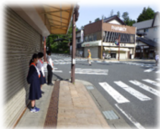
高野山中学校生徒達のあいさつ運動実施状況