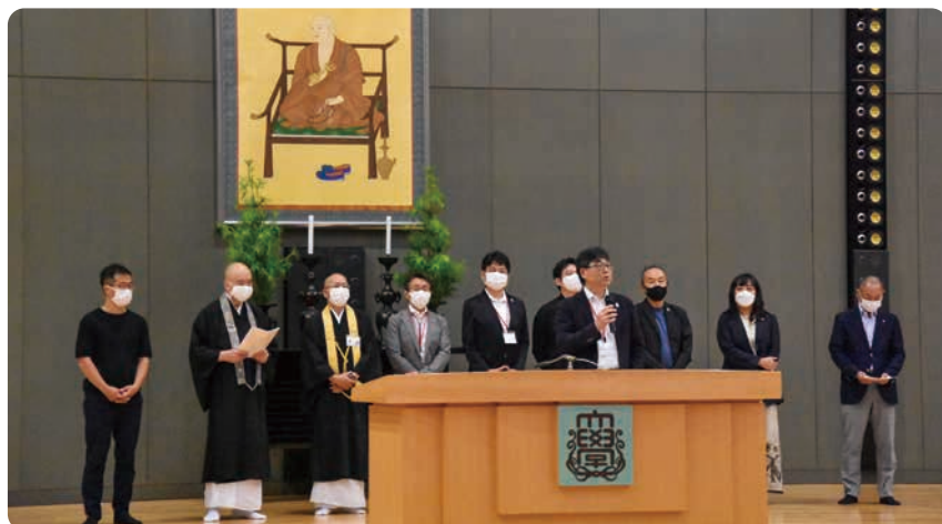
クロージング「高野山宣言」