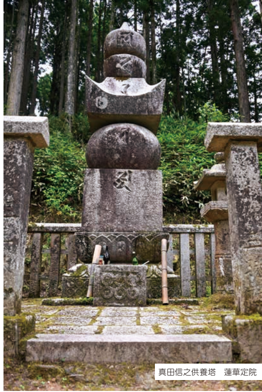
真田信之供養塔 蓮華定院

の仁」である父と弟の九度山での生活を、信之は気遣い、金銭面でも援助を行っていました。徳川の家臣としての「之」、真田家菩提寺での「幸」。この違いに父への思いがうかがえます。