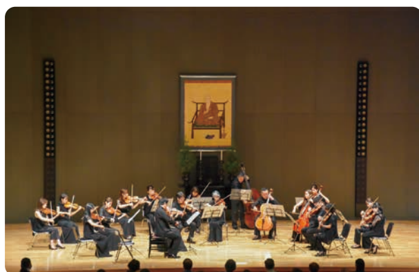
東京フィルハーモニー楽団によるコンサート