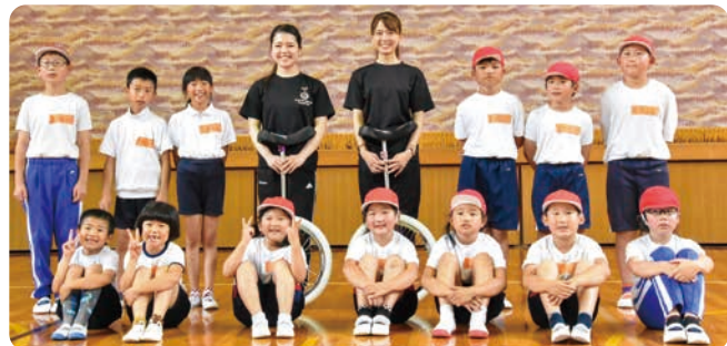
☎ 教育委員会 ☎ 0736-56-3050

花坂小学校とかつらぎ町立梁瀬小学校の児童たちが参加し、世界でも活躍されているプロの先生方から、演技や技の紹介、また実技指導を受けて児童それぞれが一息懸命練習に取り組み、乗り方や新しい技などたくさん学びました。