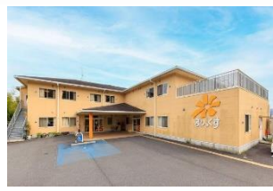
・シニアヴィラジュレ橋本 ・ジュレデイサービス