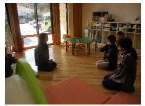
子育て座談会をしました。