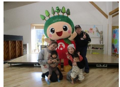
こども園の避難訓練と防火教室に参加しました。「りくぼくちゃん」と一緒に写真を撮りました!