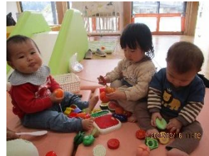
ままごと遊びをしました。