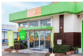
まりっくすサービスセンター本部