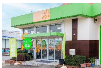
まりっくすサービスセンター本部