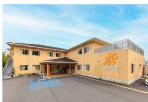
・シニアヴィラジュレ橋本 ・ジュレデイサービス