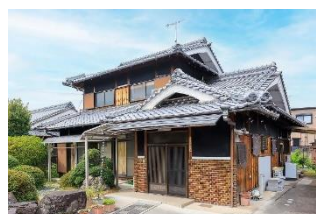
民家型デイサービスまりっくす