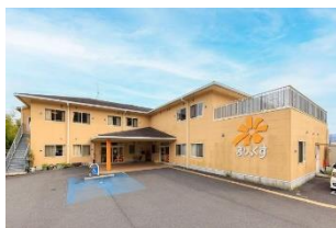
・シニアヴィラジュレ橋本 ・ジュレデイサービス