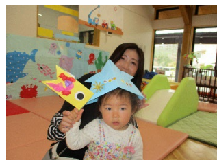
こいのぼりを作りました