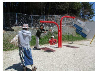
園庭遊び楽しいね